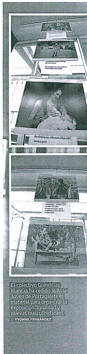
El colectivo Guindillas Blancas ha cedido al Aula Joven de Portugalete el material para organizar la exposición 'Igualdad y nuevas masculinidades'.